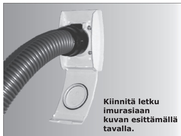
Kiinnitä letku imurasiaan kuvan esittämällä tavalla.